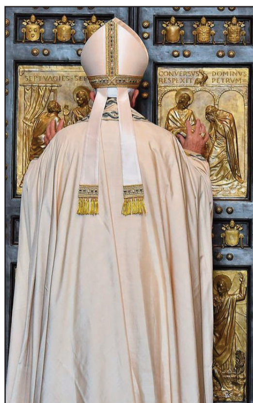
Ouverture de la porte Sainte par le Pape François