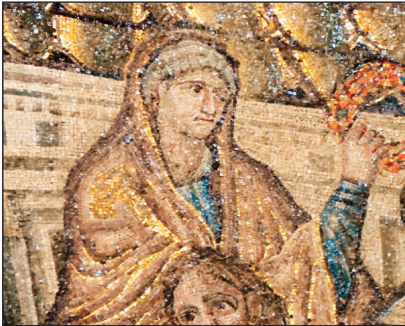
Ecclesie ex gentibus