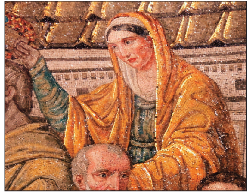
Ecclesie ex circumcissione

Dans le ciel est représenté un tétramorphe , c'est-à-dire une figuration des 4 évangélistes illustrés par leurs symboles : Matthieu, un homme ; Marc un lion ; Luc un taureau et Jean l'aigle.